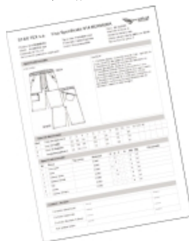
Gemini Pattern Editor - техническая карта изделия

Хотите испытать программу ? Скачайте бесплатно с сайта компании www.geminiCAD.com